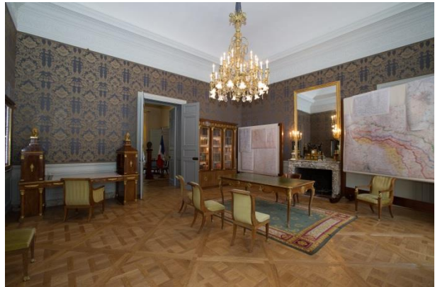
Le bureau de Clemenceau

Racheté en 1817 par l'Etat, le bâtiment devient la résidence du ministre de la Guerre. Sans autre interruption que l'Occupation, l'Hôtel de Brienne, qui a vu passer Clemenceau et de Gaulle, est aujourd'hui l'hôtel du ministre de la Défense.